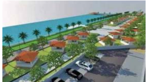
வாகன நிறுத்த வசதியுடன் அழகாக்கப்படும் வண்டியூர் கண்மாய்