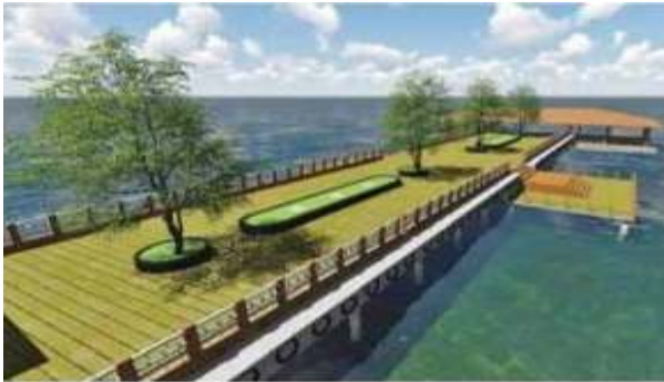
வண்டியூர் கண்மாயின் மையத்தில் அமையும் சிறிய தீவு

மதுரை வண்டியூர் கண்மாயை மேம்படுத்தி அங்கு முன்பு இருந்த பூங்கா மற்றும் வண்டியூர் கண்மாயை ரூ.99 கோடியில் ரூ.100 ஸ்பாட் திட்டத்தின் கீழ் மேம்படுத்தி சிறந்த பொழுதுபோக்கு இடமாக மாற்றும் பணிகள் முடிவறும் தருவாயில் உள்ளது. விரைவில் இப்பூங்கா மக்கள் பயன்பாட்டுக்கு வரும்.